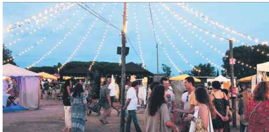
El recinte cristinenc de lleure estival de La Santa, en la segona edició, l'any passat

Després de dues edicions, l'essència d'espai a l'aire lliure que combina gastronomia, petit comerç i entreteniment es manté, però hi van polint detalls, com ara l'ambientació, que aquest cop inclourà més verd i racons de bosc encantat. Malgrat això, Rico destaca que en el pla gastronòmic combinaran el “culte a la Mediterrània i al peix” en diverses preparacions. No hi faltaran dos