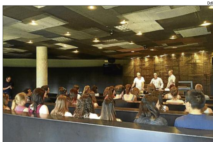
Un moment de la inauguració, a la Domus Sent Soví.

Per exemple, qualsevol usuari registrat pot notificar amb el seu mòbil o ordinador una incidència sobre mobiliari, enllumenat, espais verds o via pública, adjuntant una foto, descripció textual i geolocalització. Un cop revisada la incidència, aquesta apareix en un mapa global d'incidències i es pot fer el seguiment dels diferents estats: pendent, en procés o resolta. A més, altres usuaris registrats poden afegir comentaris, ha informat l'Ajuntament.