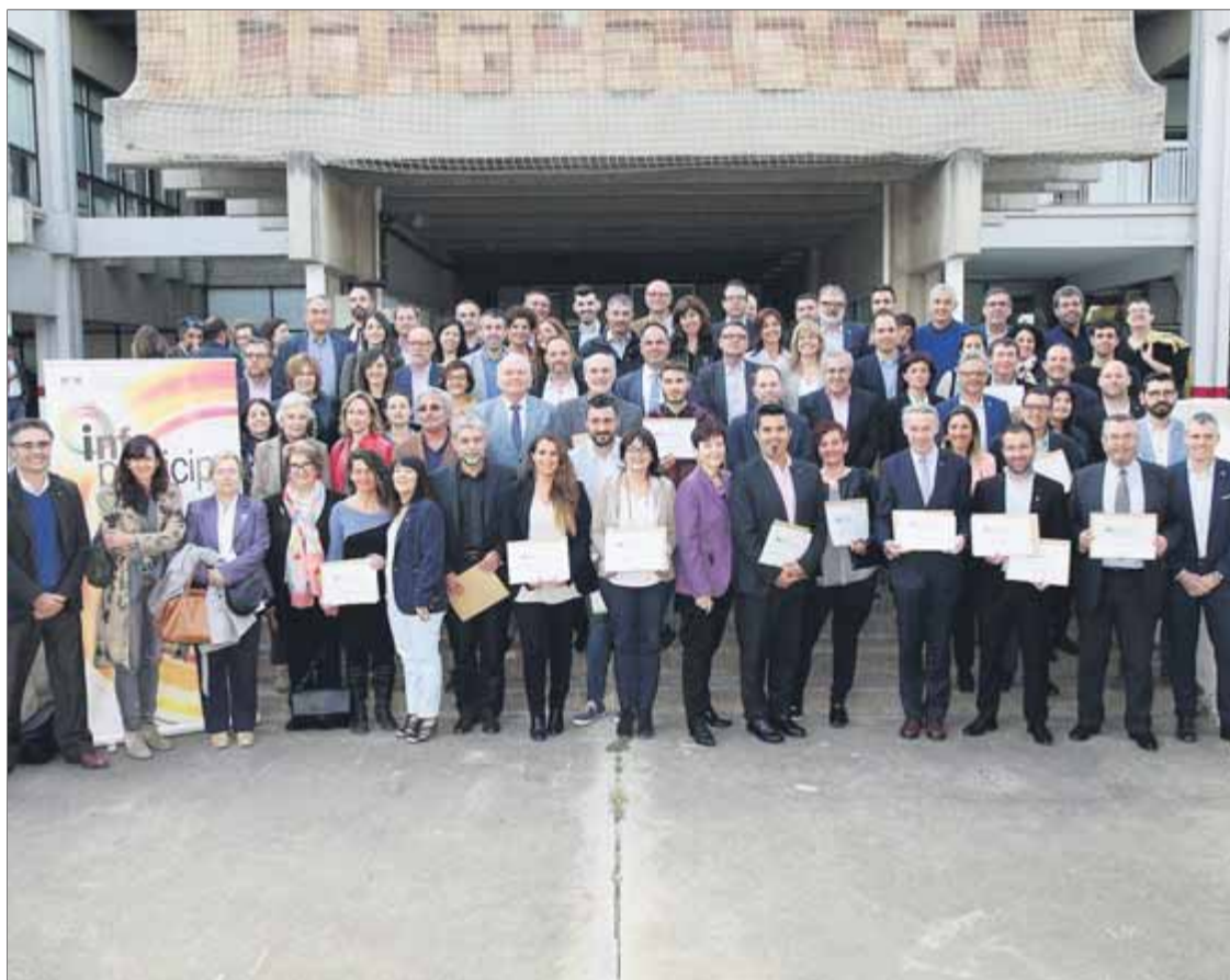
Representants dels municipis i consells comarcals que han rebut la distinció ■ REDACCIÓ

Es tracta dels de Santa Coloma de Gramenet, Manresa, Castelldefels, Gavà, Vic, Premià de Mar, Olesa de Montserrat, Manlleu, Sant Quirze del Vallès,