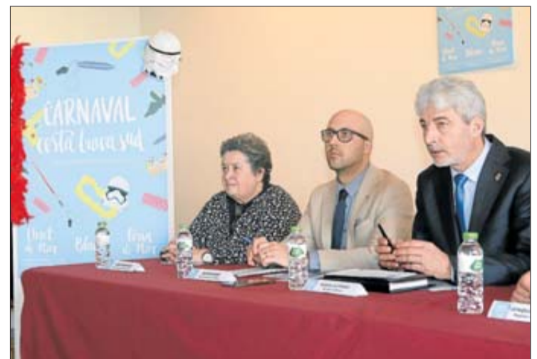
L'acte de presentació es va fer a Casa Saladrigas de Blanes. CARLES COLOMER

A Lloret, la Gran Rua de Carnaval serà, com cada any, dissabte 25, a les quatre de la tarda, i diumenge 26, a les dotze del migdia, i recorrerà el passeig marítim i l'avinguda de Just Marqués fins a acabar al final de l'avinguda del Rieral. Hi participen més de 25 carrosses i comparses i més de 1.600 persones. A Tossa, el Carnaval es portarà a terme del 23 de febrer a l'11 de març, sent aquest últim el dia de celebració de la Gran Rua de la Ressaca del