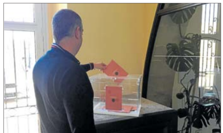
Un veí votant ahir al matí. MARC SUREDA

El regidor d'Hisenda de l'Ajuntament de Llagostera, Ramon Soler, es va mostrar molt satisfet amb el ritme de les votacions, que ha superat en escriure el de l'any passat, on van comptabilitzar-se un total de 345 persones.