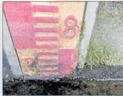
L'aigua al Ter, sota mínims. JOSEP QUINTANAS