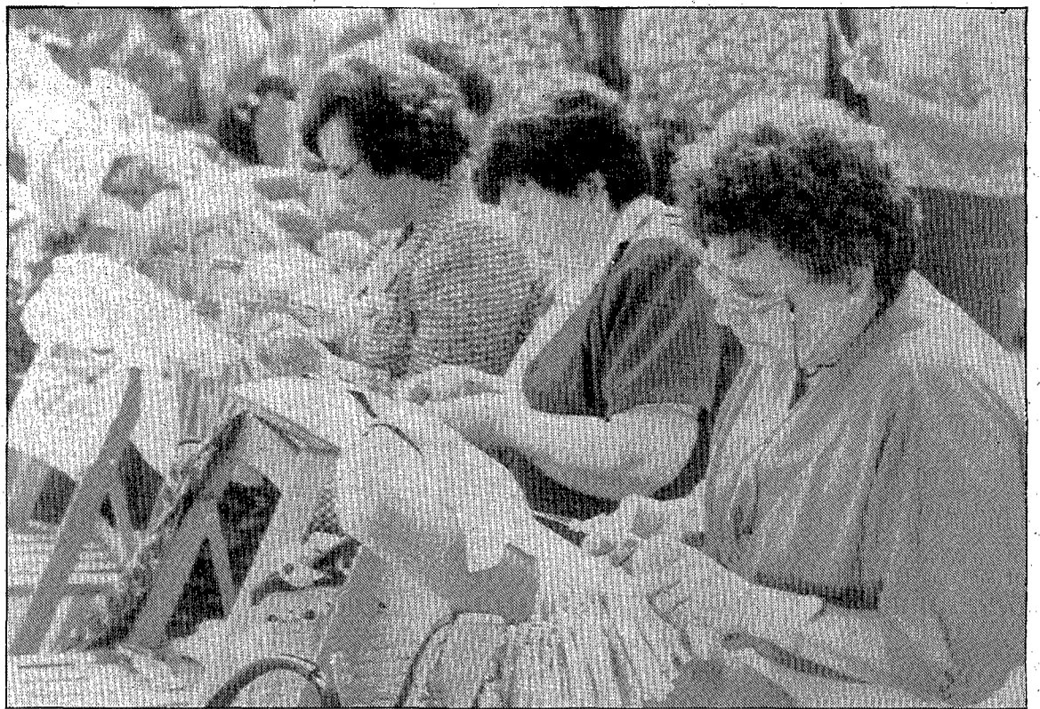
Les nombroses puntaires es van veure envoltades en tot moment per un públic massiu i curiós.

També en part a elles, estava dedicada aquesta diada, en la qual van haver-hi actuacions musicals, com la de la cobla Ciutat de Calella o la Coral polifònica, més esbarts i actuacions de grups folklòrics estrangers, com el Bayerverein Pforzheim, a més d'un «esmorzar de germanor a la paròquia i un dinar al pavelló».