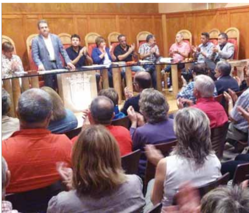
Tots els regidors de totes les formacions han format un govern d'unitat. A la fotografia, el ple de suport a la consulta del 9-N

Una llista unitària podria recollir de manera important el suport ciutadà. Alhora, però, també pot beneficiar altres formacions que ara no tenen representació i que reclamen el paper d'oposició.