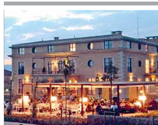
El nou hotel, inaugurat aquest estiu, utilitza el primer sistema híbrid de geotèrmia de l'Estat ■ EL PUNT AVUI

Els mateixos agents van participar en dues operacions més durant el