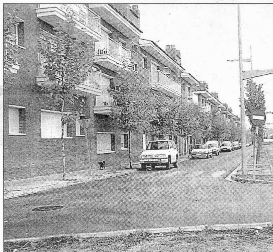
El gràfic mostra com quedarà urbanitzat el pla parcial de Sant Jaume, a l'entrada del poble. A sota, una part de l'actuació residencial del Mas Ros, que ja està pràcticament acabada.

nístics estaven aturats per beneficiar els interessos especulatiu de militants i simpatitzants de CDC que tenen propietats al pla de la Mullera, també a l'entrada del poble.