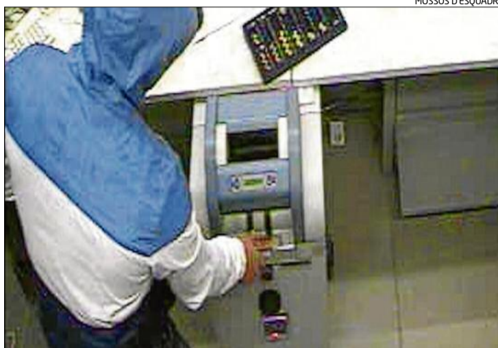
Imatge d'un dels atracadors agafant diners d'una entitat bancària.

La investigació es va iniciar el 13 de setembre després d'un atracament a una entitat bancària de Barcelona perpetrat per un sol home, que va intimidar amb un ganivet una de les treballadores de l'oficina. Passats quinze dies el mateix atracador va assaltar una altra entitat bancària de Barcelona, aquesta vegada acompanyat per un altre home, i tots dos van intimidar les víctimes amb un ganivet de grans dimensions i una pistola.