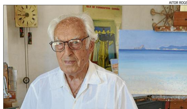
Una imatge de l'artista i pintor Rafael Bataller i Giralt.

Miguel Primo de Rivera va exercir una dictadura a l'Estat des del 1923 fins al 1930. Durant aquests anys, va combatre tota la simbologia del catalanisme.