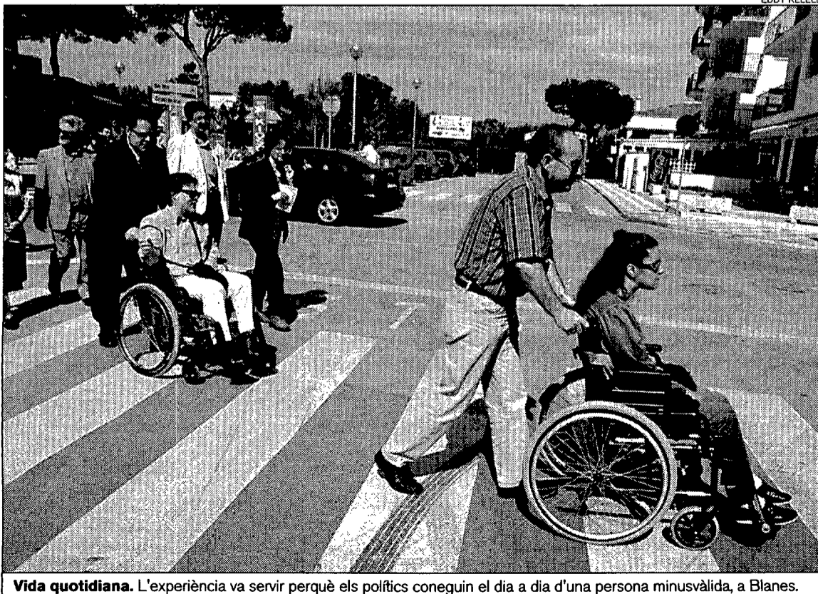
Vida quotidiana. L'experiència va servir perquè els polítics coneguin el dia a dia d'una persona minusvàlida, a Blanes.

Durant la passejada, que va aplegar una dotzena de persones minusvàlides que anaven acompanyades per familiars i membres de l'organització i dels polítics de Blanes, es van repartir uns fullets que portaven el lema Supressió de bar-