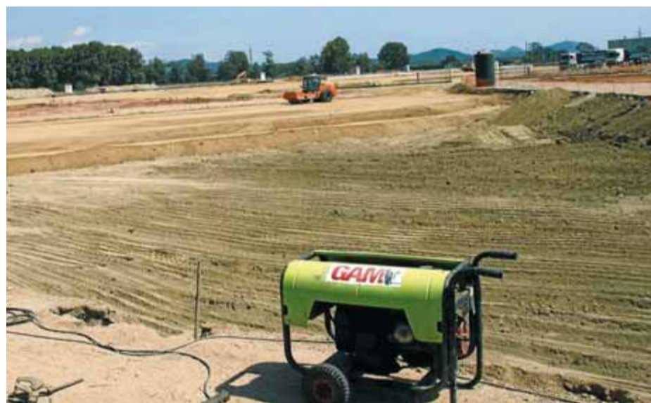
Les piconadores treballen als terrenys on es farà el nou centre d'Inditex, a Tordera

Precisament, la clausura de la històrica Fibracolor, empresa participada per Inditex i dedicada a la pintura, el blanqueig i els acabats tèxtils, va suposar l'acomodament de prop de 430 treballadors.