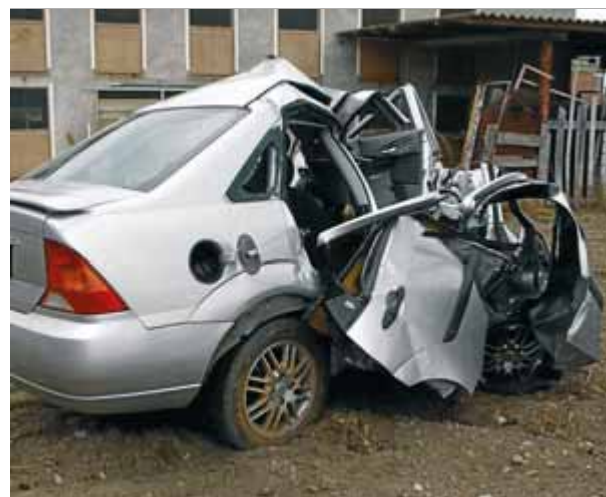
EL PUNT AVUI

compte a Facebook tampoc protegeix l'usuari del fet que la seva informació pugui ser espiada. "Facebook sap més de vostè que la seva pròpia família", asseguren. L'organització tanca el comunicat amb el seu popular lema: "Som Anonymous. Som legítim. No perdonem. No oblidem. Espera'ns". La iniciativa per posar fi a la xarxa social té pàgina a Facebook, on apareix un comunicat dirigit a la xarxa social: "Facebook, heu començat a censurar els nostres comptes sense motiu. Ha arribat el moment de parar. Aquesta és l'anonop real que posarà fi a la censura a Facebook". El grup d'activistes també ha creat un xat, un compte a Twitter, @OpFacebook, i el hashtag #opfacebook. ■ REDACCIÓ