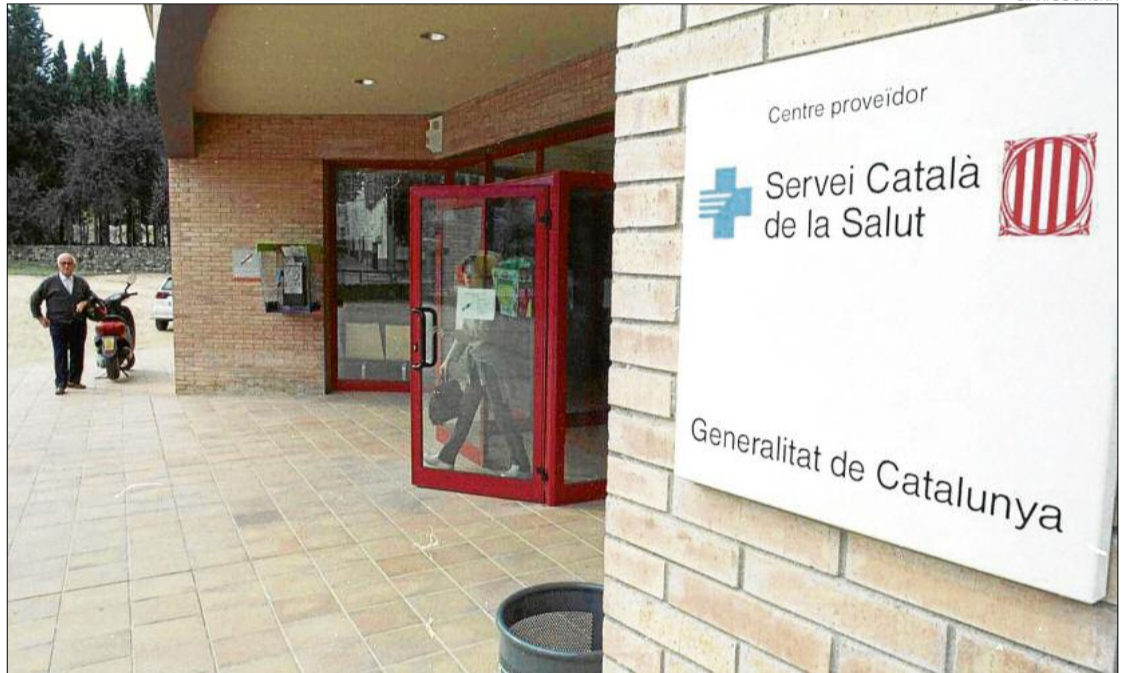
El centre d'atenció primària d'Anglès, en una imatge d'arxiu, dona servei d'urgències als pobles veïns.

Aquesta reunificació de les guàrdies de moment no està confirmada oficialment per part del Govern català però el consistori d'Anglès va decidir portar aquesta moció per via d'urgència al ple, que també es distribuirà a d'altres pobles per fer força davant de Salut i també després que l'entitat Veu del Poble d'Anglès entrés un escrit a l'ajuntament junt amb unes 300 fir-