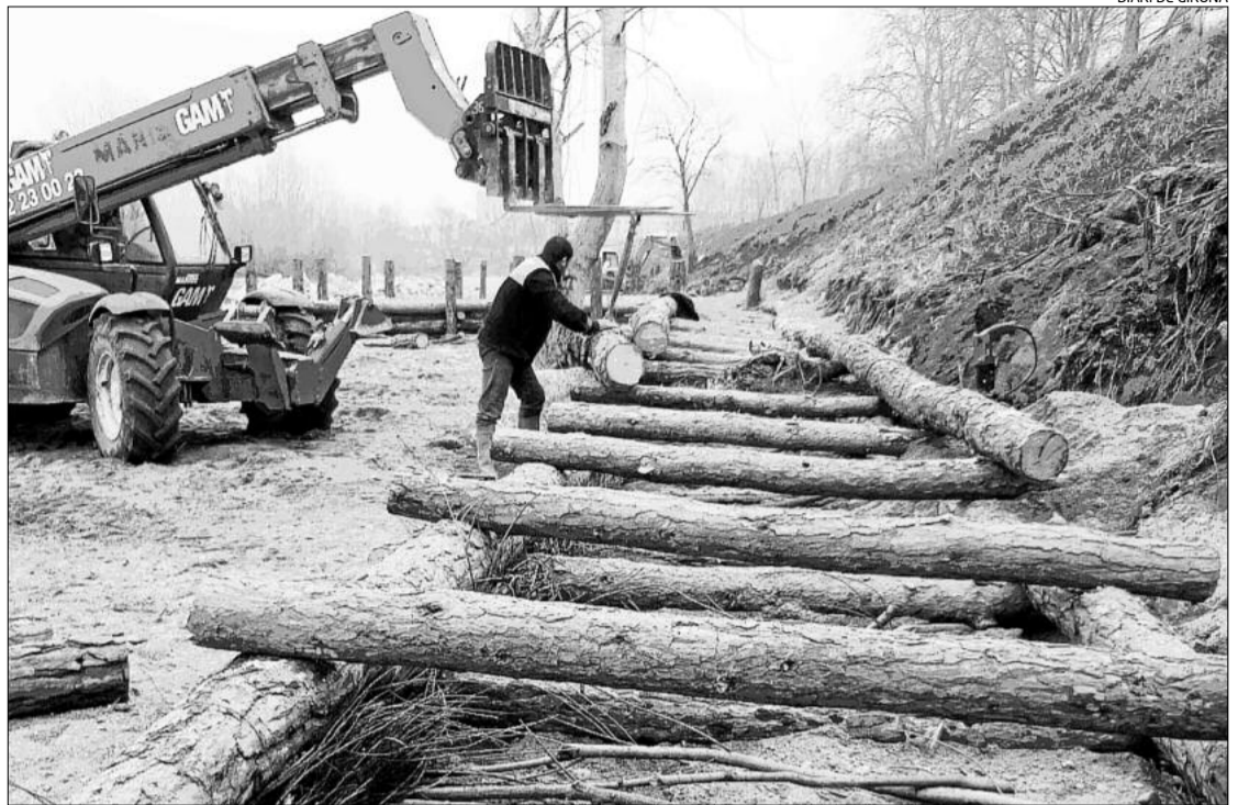
Els operaris construïnt els deflectors a base de troncs de pi que s'instal·laran al marge del riu.

gües. Les obres consisteixen en la col·locació de tres deflectors al marge dret del riu -a l'alçada del pàrquing del mercat- per ajudar a què en moments de crescudes el curs de l'aigua es desplaci cap al centre de la llera, afavorint la sedimentació de sorres al revers de les estructures i, com a conseqüència, minimitzar l'impacte de