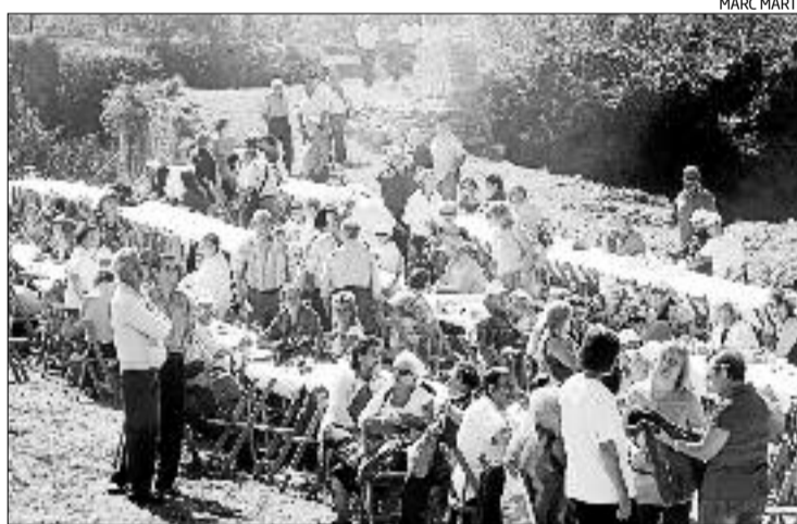
Moment de la trobada, amb alguns participants a les taules del dinar.

Aquesta reivindicació no és nova i, de moment, mai s'ha desencallat. Llorente remarcava la llum com la «condició mínima» que hauria de tenir el recinte perquè l'entitat pogués fer activitats durant la resta de l'any. «El Caserón» va ser un edifici que va tenir, allora, diverses funcions: església; lloc d'atenció pel metge i infer-