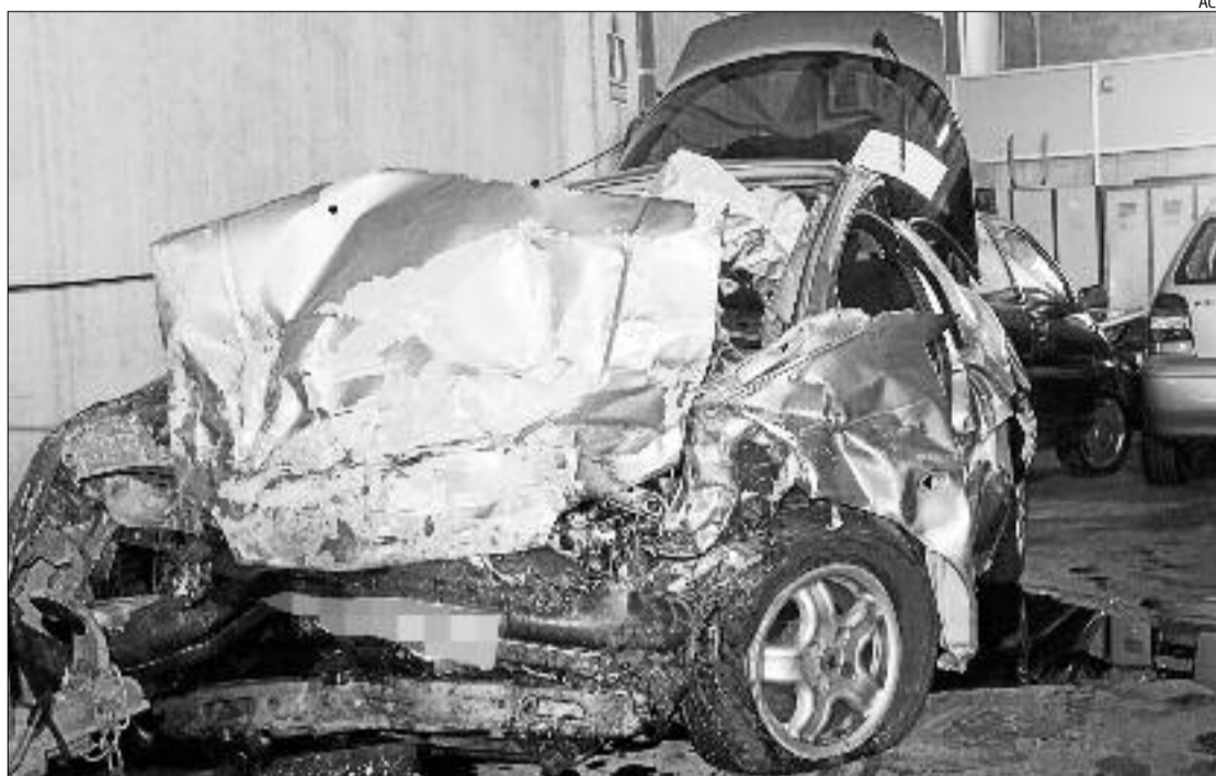
Estat en què va quedar un dels dos vehicles implicats en el sinistre.

Aquest és l'accident més greu ocorregut la darrera setmana. El més aparatós es va produir dimarts a la N-II al seu pas per Vidreres, quan dos camions de gran