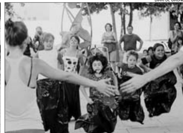
DIARI DE GIRONA