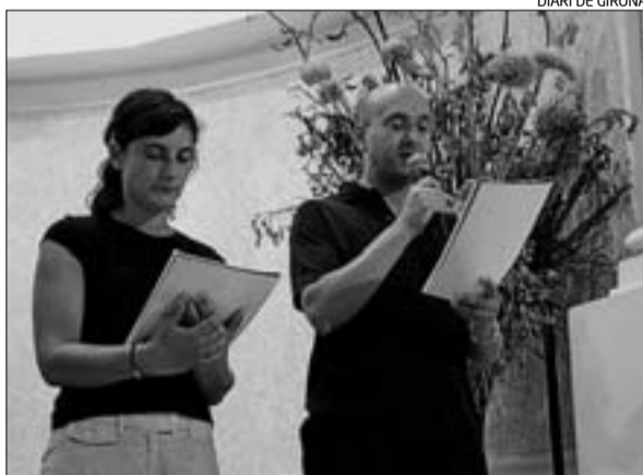
DIARI DE GIRONA

► Igual que moltes altres localitats gironines, Bordils celebra aquest cap de setmana la seva Festa Major. Per això, ahir al matí es va fer l'activitat de dibuix infantil «pintem amb peus i mans», així com un torneig de futbol i jocs de cucanya per a infants d'entre 3 i 12 anys. A més, a la nit s'esperava l'Encivada't Tour, amb els Diables de l'Onyar, i tot seguit l'actuació d'Hotel Cochambre, per acabar amb una batalla de DJ: els de la Bisbal contra els de Bordils. Per avui al matí està previst un torneig de futbol sala entre el Jovent de Bordils, la Pioixa, l'AMPA Bordils i els Veterans Futbol. A la tarda serà el torn de la Gran Cercavila, que comptarà amb els geganters de la Bisbal, Faça i Riudellots, així com castellers i, a la nit, gran ball amb l'Orquestra Metropol. BORDILS | DdG