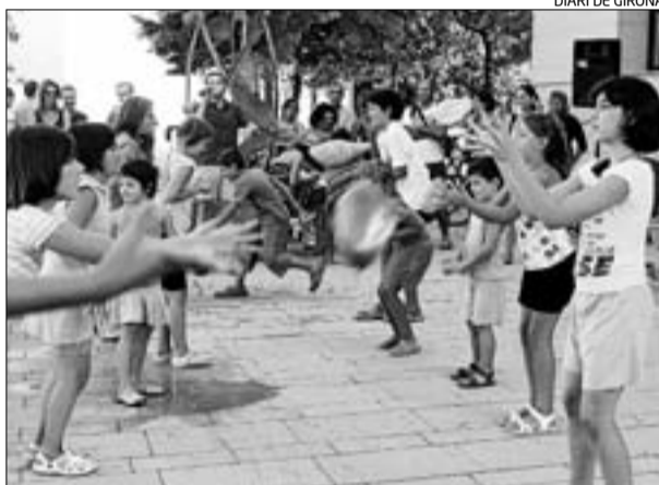
DIARI DE GIRONA

► La regidoria de Joventut de Tordera va organitzar ahir el tercer Concert de Bateria a la plaça de l'Església, dins els actes de la Festa Major. Nombroses bateries van instal·lar-se a la localitat i van oferir conjuntament un concert. Avui la festa continuarà amb el tercer torneig d'Icestock, mentre que a les deu del matí hi haurà el vuitè torneig de bitlles catalanes. A més, també es farà una passejada amb motos clàssiques, un torneig local de tir al plat, un motorshow i es presentaran els partits d'hoquei de la temporada 2009-2010. Tot seguit tindrà lloc el partit CP Tordera 1a Nacional-Igualda HC. Finalment s'homenatjarà la parella de més edat i es farà un concert jove a partir de les onze de la nit. TORDERA | DdG