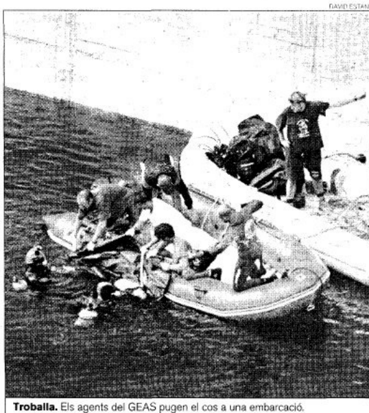
Trobada. Els agents del GEAS pugen el cos a una embarcació.