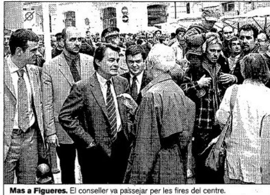
Mas a Figueres. El conseller va passejar per les fires del centre.

Interrogat sobre el futur del projecte del Palau de Fires i Congressos de Figueres, Artur Mas no va voler prometre res, tot i que assenyalava que existeix «un compromís polític de la Generalitat». El conseller en cap va dir que era necessari parlar amb l'Ajuntament perquè «es-