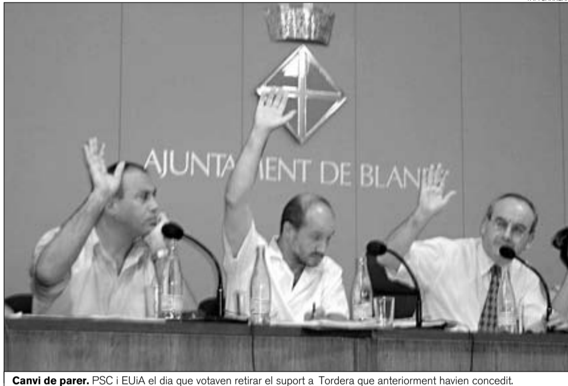
Canvi de parer. PSC i EUiA el dia que votaven retirar el suport a Tordera que anteriorment havien concedit.

Puig ha recordat que el consistori blanenc ha organitzat unes jornades de debat en les quals s'ha convidat tant la Plataforma Salvem Jalpí com a l'Ajuntament de Tordera. En aquestes jornades, el cap de setmana del 18 d'octubre, tots els interessats podran explicar la proposta i visió sobre aquest vial així com altres temàtiques referents a la mobilitat. Per aquest motiu, el dirigent republicà lamenta que Tordera «en lloc d'acceptar el diàleg i el debat, torni a recórrer a l'atac». Puig recorda que s'ha d'acceptar que un plenari revocui un acord, veu l'actitud de Tordera com a