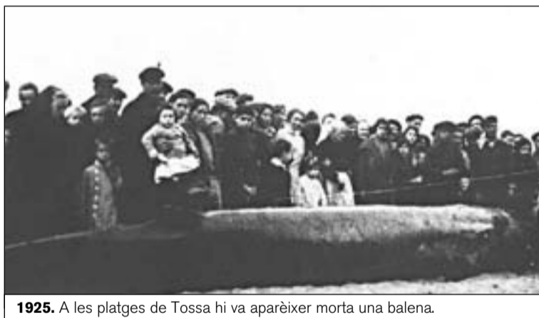
1925. A les platges de Tossa hi va aparèixer morta una balena.

De fet, l'especimen trobat a Tossa de Mar tenia alguns símptomes d'haver estat mossegat per alguns peixos.