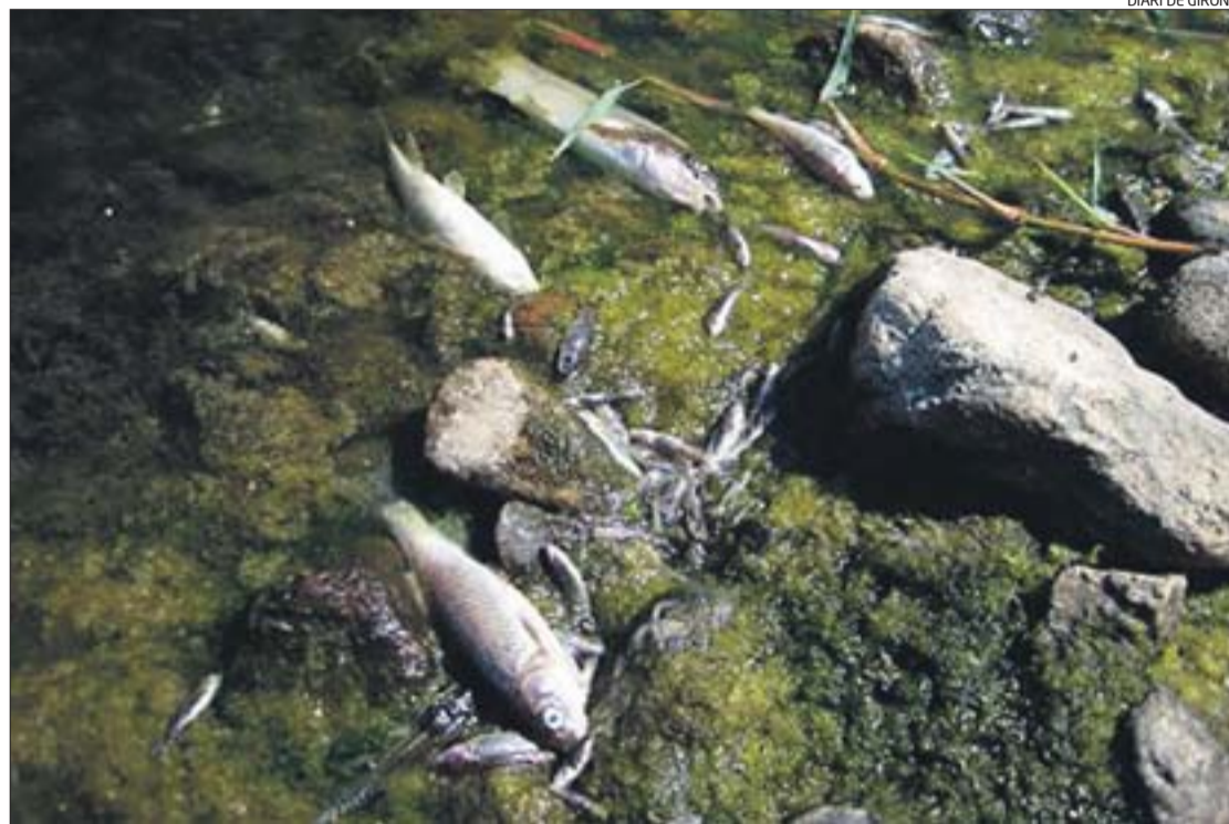
Imatge de peixos morts que van ser trobats en un tram del riu Tordera que passa per Fogars de Tordera.

► Una inspecció delimita entre el polígon industrial i l'autopista la zona que ha estat afectada