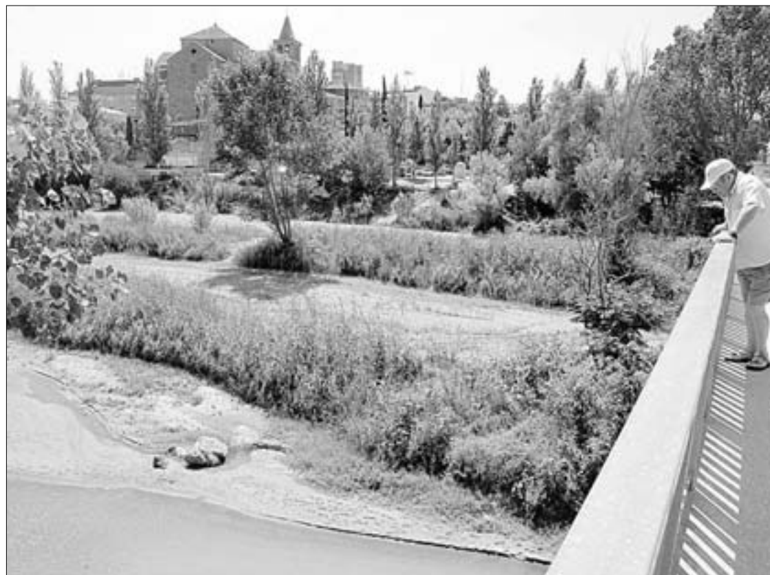
RIU TORDERA. El municipi aboca l'aigua tractada al riu en lloc del mar.

De tota manera, García va manifestar que en el cas de les ur-