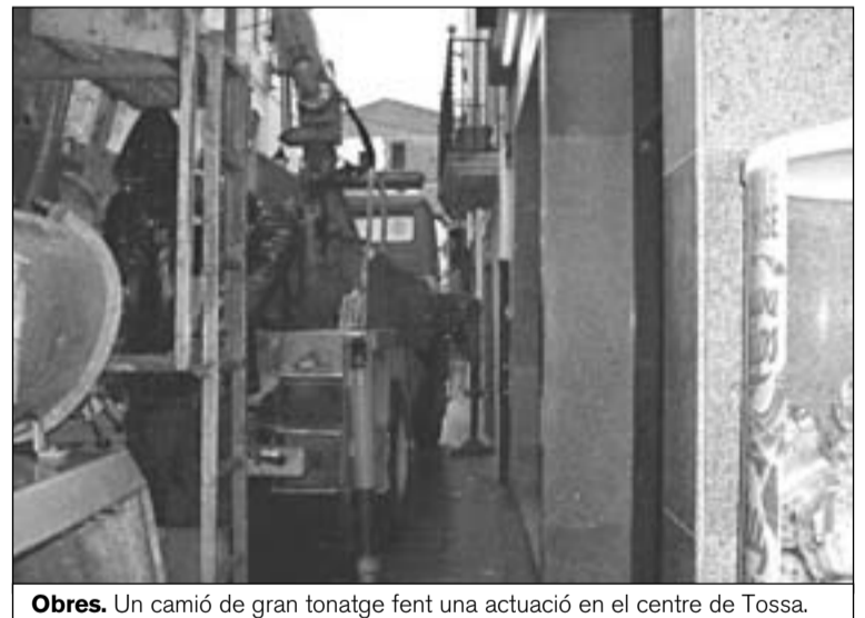
Obres. Un camió de gran tonatge fent una actuació en el centre de Tossa.

Per aquest motiu, fins i tot, l'Ajuntament de Tossa ha acordat que es pugui imposar sancions a les empreses responsables obligant-les a arreglar els desperfectes a les zones afectades, ja que alguns veïns del centre de la vila ja s'han queixat per aquest fet.