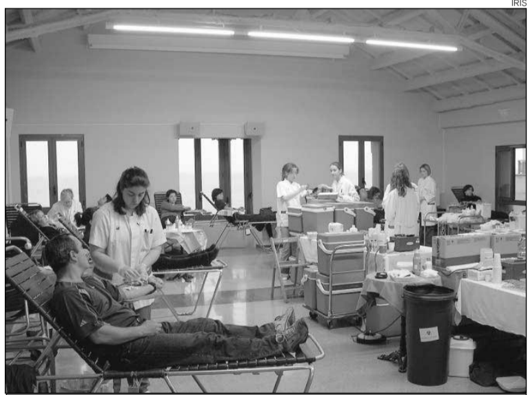
Marató. Les donacions de sang es van fer a la Casa del Poble de Blanes.

Així, els autors destaquen que l'alimentació correcta del nen durant els primers mesos i anys és crucial per al seu creixement, però durant la infantesa és un moment molt complicat per seguir una dieta equilibrada, a causa dels gustos i les manies dels nens, fet que s'intenta evitar amb iniciatives com aquesta. J.A.G.