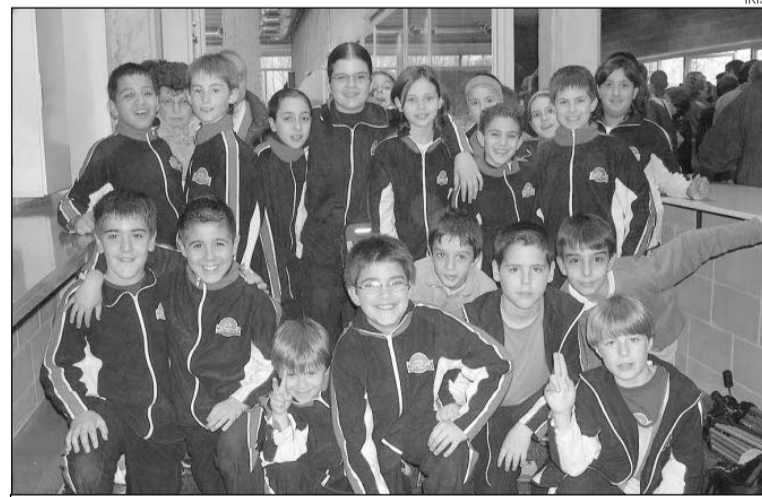
Inauguració. Un grup de joves esportistes locals que utilitzen l'equipament.

L'acte va constar de dues parts. Durant la primera es va fer l'acte oficial d'inauguració, que estableix l'obertura de portes de l'equipament, la descoberta d'una placa commemorativa, la visita guiada per les instal·lacions i els parlaments inaugurals. Una vegada realitzats els parlaments de l'alcalde i el secretari general d'Esports, es va oferir un refrigeri per als nombrosos assistents presents a l'acte. Finalment es va iniciar la part ludicofestiva de l'acte amb un partit de bàsquet entre un combinat del Club Bàsquet Tordera i una selecció d'exjugadors de la secció de bàsquet del FC Barce-