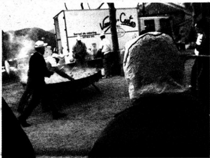
L'ermita de l'Erola i els participants en la romeria. A dalt, l'arrossada popular remullada per la pluja i els qui es van instal·lar per dinar.