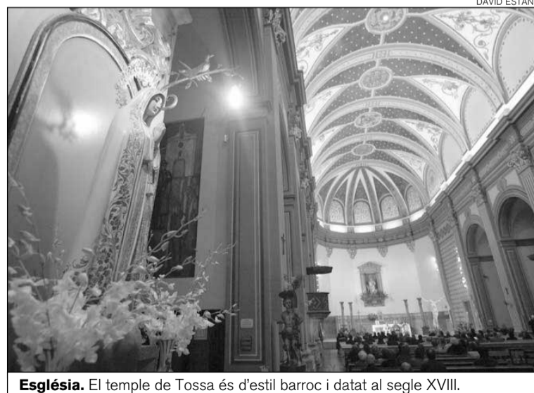
Església. El temple de Tossa és d'estil barroc i datat al segle XVIII.

L'exposició de La Nau —que porta per nom Sant Vicenç, 1.700 anys — reivindica la figura del màrtir a propòsit del seu martiri a València el 22 de gener de 304. L'exposició té 250 peces procedents d'una cinquantena de punts diferents.