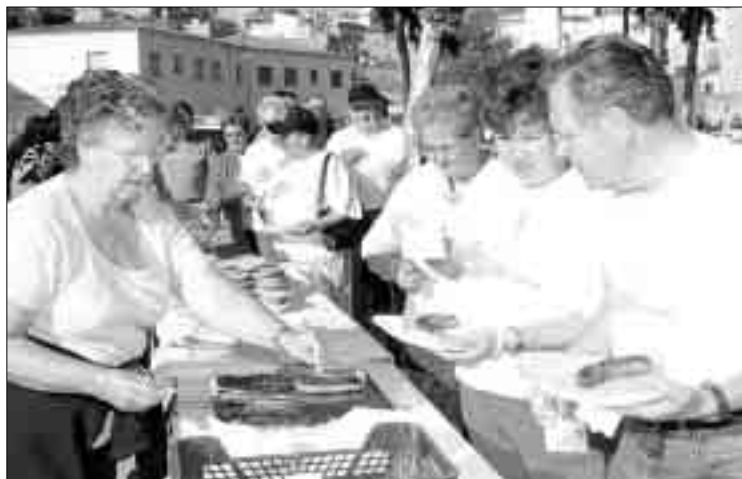
BOTIFARRADA. Es va portar a terme a primera hora del matí.