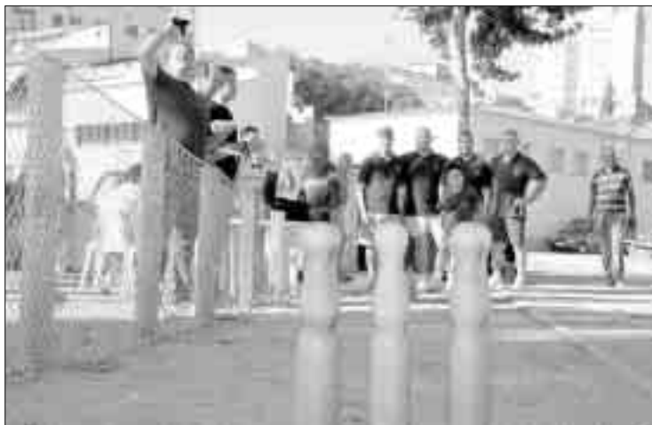
CAMPIONAT. El torneig de bitlles catalanes va ser molt seguit.