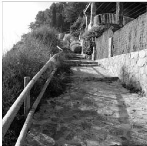
RACONS AMB ENCANT. La marxa promociona els espais naturals de Tossa.

Amb aquesta marxa popular, el Centre Excursionista de Tossa té la intenció d'incorporar-la com una activitat més de la seva programació anual.