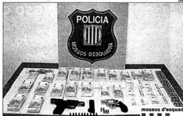
El botí que els dos atracadors havien aconseguit a Bujaraloz, a l'Aragó.