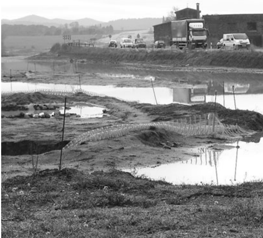
Els terrenys on s'havien començat les obres a Maçanet són ara mateix un fangar.

Entre les millores que s'introduiran en el tram Maçanet-Sils, destaca que es facilitaran els moviments locals per travessar la carretera de banda a banda. Les més de 400 persones que viuen a la urbanització Montbarbat seran de les més beneficiades, perquè evitaran haver de fer més de 6 quilòmetres per accedir al poble. L'Estat farà una rotonda nova a la zona de Can Castells que connectarà amb les vies de serveis, des d'on es podrà accedir al poble a través d'un pas superior. Des d'allà es farà un vial que anirà fins al centre de Maçanet a través de la zona on hi ha la fàbrica Tretty, i que ha de ser el futur polígon industrial del municipi. Altres mesures seran la construcció d'un fals túnel al costat de la Torre de Cartellà, per evitar l'impacte que l'autovia representava per a aquest bé patrimonial d'interès nacional, i la millora de l'enllaç de l'A-2