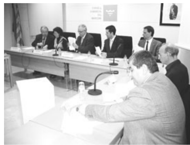
Un moment de la signatura, ahir, al Consell Comarcal.

passada la temporada turística. Les previsions amb què treballa l'ACA són que l'EDAR pugui entrar en funcionament el 2010.