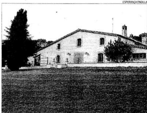
La finca de Cal Cluquis està situada a uns tres quilòmetres de Vidreres.

Un familiar va veure el cotxe de l'home, es va esverar en no trobar-los i al cap de poc localitzaven els cadàvers