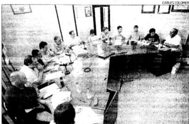
ERC i PSC governen amb minoria, amb només 5 dels 13 regidors.

En concret, aquestes van començar dimecres a la nit i d'aquesta reunió el que n'ha trascendit és que totes les forces polítiques han arribat a un pacte de silenci fins que no arribin a un acord. És a dir, que mentre duren