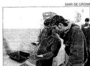
Una imatge dels alumnes del curs.

Aquest és el primer conveni que signa l'entitat Orchis, de recent creació amb l'Ajuntament. Aquesta a més, recorda que el municipi del Maresme té moltes zones humides i que gaudeixen de diverses figures de protecció legal i que històricament han patit una transformació del territori i d'una mala reputació fins a fragmentat i reduir la seva extensió a petits estanys i ambients aigualosos.