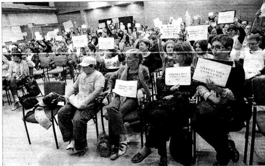
La Sala Laguna de Sils, plena de gom a gom durant la intervenció del representant d'Educació

Tot i això, també va recalcar davant les contínues protestes dels assistents, que amb petites pancartes demanaven «escola nova ja», que la previsió era, amb dades del padró que tenien, que hi hauria tres grups de P-3, però finalment no ha estat així, segons Otero. Pel que fa al curs 2010-2011, el director dels serveis territorials es va mostrar optimista perquè «si el nombre d'alumnes hi és, podria néixer una nova escola amb mòduls». Malgrat això, per a aquest any Otero va oferir que a canvi de no fer l'escola, si hi ha pressupost, augmentaria el nombre de docents a l'actual escola, que es troba saturada. Pel que fa a dades actuals de saturació del col·legi, el director dels serveis territorials va negar que hi hagi més alumnes per