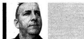
Narcís Serra i Riera

«La Selva marítima està governada per CiU. El seu líder, Artur Mas, ha declarat que votaria afirmativament si visqués a Arenys de Munt»