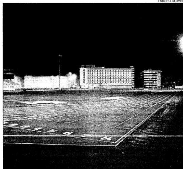
L'estat que presenten en l'actualitat les noves pistes d'atletisme.

El projecte de remodelació de les pistes d'atletisme ha costat gairebé 800.000 euros a Lloret, tot i que la Generalitat ha acordat destinar-hi una subvenció valorada en més de 100.000 euros.